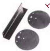
KIT À POSER