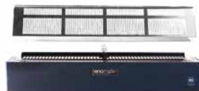
KIT TIROIR INFÉRIEUR BICOLORE