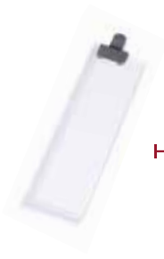
KIT DE CONFIGURATION ZONE VIN ROUGE ET ZONE VIN BLANC