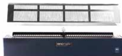
ZWEIFARBIGES UNTERES SCHUBLADENKIT