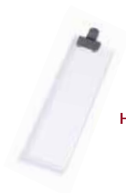
KONFIGURATIONSKIT FÜR ROTWEIN- UND WEISSWEINBEREICH